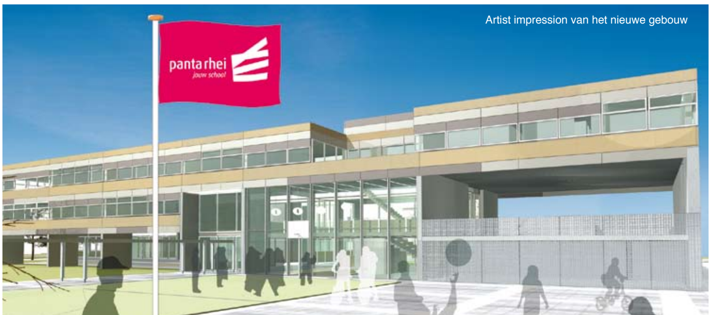
Artist impression van het nieuwe gebouw