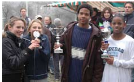
De trotse winnaars van de kerstcross