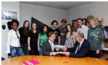
Ondertekening overeenkomst ROCvA

Als u naar aanleiding van dit blad vragen, opmerkingen en/of suggesties heeft, zijn deze welkom op het emailadres perspectief@sgpantarhei.nl . Het emailadres nieuwbouw@sgpantarhei.nl behoort hiermee tot het verleden.