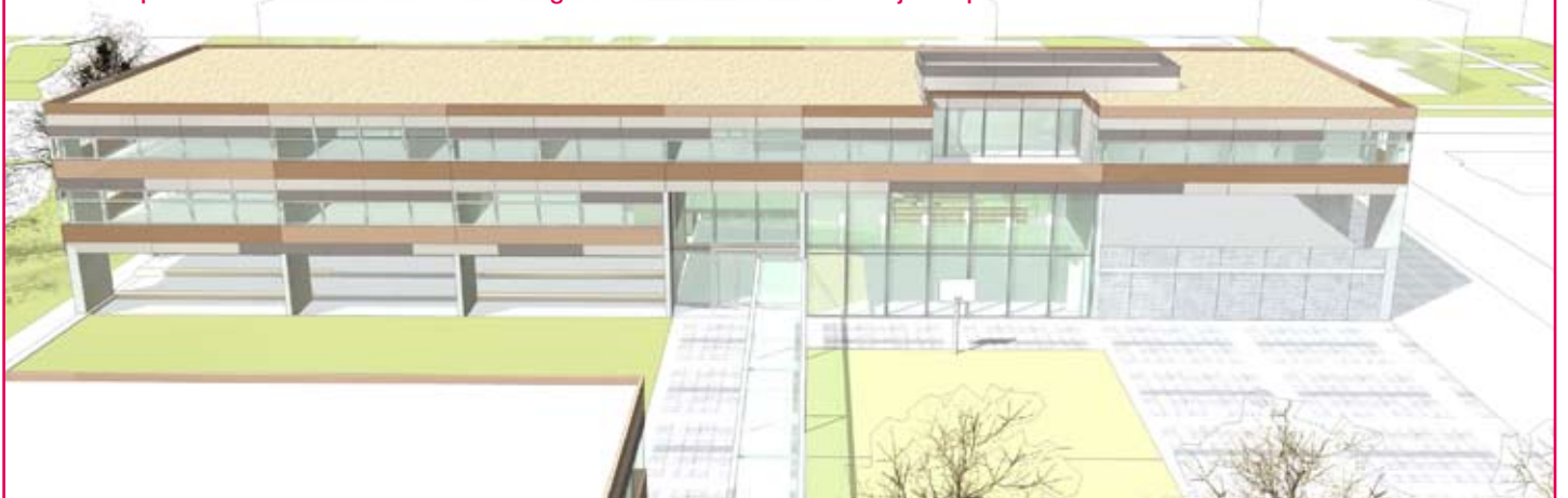
Artist impression van het nieuwe onderbouwgebouw met links de tribune bij het sportveld en rechts de aula met een lichte 'vide'

"Op ICT-gebied krijgt Panta Rhei echt de nieuwste ontwikkelingen, zodat de moderne apparatuur die we al hebben, ten volle benut kan worden. En de digitale schoolborden moet ik ook niet vergeten. Het wordt echt geweldig. Nú al", besluit hij, nog steeds even enthousiast, "nú al kan ik me enorm verheugen op de hele uitstraling van de nieuwe gebouwen. Schitterende ruimten, functioneel en onderhoudsvriendelijk. Absoluut een school die gaat voldoen aan alle eisen die modern onderwijs stelt." <