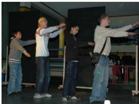
Theatergroep Pro-Phaistos en leerlingen in 'Game Over'

Op vrijdag 21 december hebben de leerlingen van de onderbouw geboeid gekeken naar de voorstelling 'Game Over', die gespeeld werd door Theatergroep Pro-Phaistos uit Groningen. Het onderwerp was pesten. Daar de voorstelling zowel voor- als nabesproken is, zijn de vervelende gevolgen van uit de hand lopende pesterijen weer eens onder ieders aandacht gebracht.