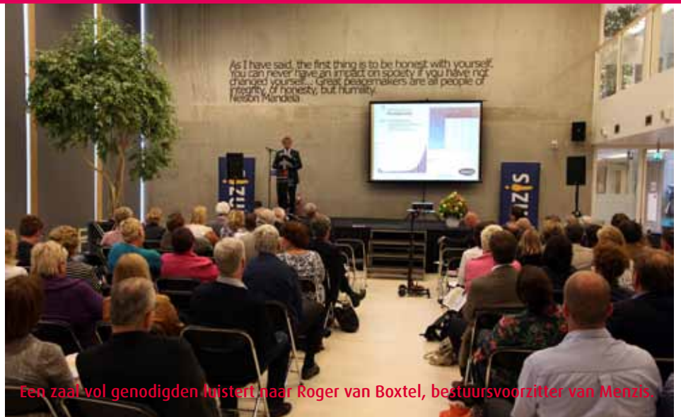
Een zaal vol genodigden luistert naar Roger van Boxtel, bestuursvoorzitter van Menzis.

Aanwezig waren zeventig vertegenwoordigers van zorginstellingen en scholen uit de regio, ambtenaren, politici en medewerkers van de school. Zij legden contact met elkaar om het probleem van het personeelstekort in de zorg binnen de regio aan te pakken. Panta Rhei heeft zo bijvoorbeeld nieuwe stageplaatsen voor leerlingen gevonden. Zeven leerlingen van de afdeling Zorg en Welzijn en de internationale schakelklas hielpen bij de catering. Zij kregen een warm applaus van de deelnemers.