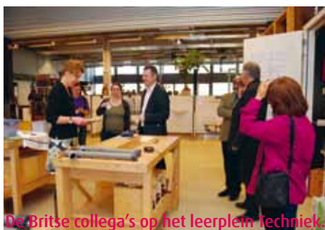
De Britse collega's op het leerplein Techniek

In april brachten de Britten een tegenbezoek aan onze school. Zij waren niet alleen opgetogen over onze gebouwen, maar gaven daarnaast de schoolleiding een compliment over de docenten die ze ontmoetten en het voorbeeldige gedrag van onze leerlingen. We hebben met de Forest Gate Community School afgesproken om ook in de toekomst contact te houden.