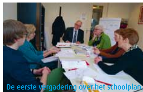
De eerste vergadering over het schoolplan

Zoals onze algemeen directeur/bestuurder al aangaf in zijn column op pagina 2, werkt Panta Rhei momenteel aan een nieuw schoolplan. Het nieuwe schoolplan gaat halverwege het schooljaar 2013-2014 in en heeft een looptijd tot en met 2017. Een schoolplan is een wettelijke verplichting en is voor elke school een belangrijk koersdocument met betrekking tot de schoolontwikkeling. Medio november hopen wij ons nieuwe schoolplan te publiceren.