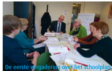
De eerste vergadering over het schoolplan

Zoals onze algemeen directeur/bestuurder al aangaf in zijn column op pagina 2, werkt Panta Rhei momenteel aan een nieuw schoolplan. Het nieuwe schoolplan gaat halverwege het schooljaar 2013-2014 in en heeft een looptijd tot en met 2017. Een schoolplan is een wettelijke verplichting en is voor elke school een belangrijk koersdocument met betrekking tot de schoolontwikkeling. Medio november hopen wij ons nieuwe schoolplan te publiceren.