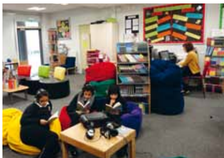
Londen, Forest Gate Community School: sommigen krijgen extra tijd om te lezen.

In maart bezochten enkele docenten en andere medewerkers twee scholen in de wijk Newham in Londen. Het doel van dit geslaagde bezoek was om te leren hoe onze Engelse collega's omgaan met leerlingen met een onderwijsachterstand.