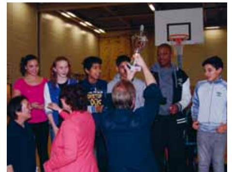
Trotse winnaars bij de prijsuitreiking.

vaardigheden die ze tijdens de projectweek hadden opgedaan. Na twee uur stonden er prachtig gedekte tafels met daarop sierlijke driegangenmenu's te wachten op de jury. De trotse teams lieten hun gerechten proeven en gaven uitleg. Voor het winnende team uit klas 1bks was er een prachtige wisselbeker. Maar dat was nog niet alles, want daarbij kregen de winnaars de uitnodiging om in twee groepen in de keukens van Restaurant Amstelfort en The Wine Kitchen een diner voor hun familie te komen koken. De tweede en derde prijs gingen naar klas 1kgs en 1b1.