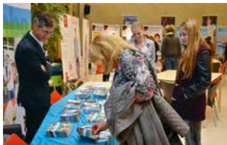
Informatiekramen op de Scholenmarkt.

Voor het eerst organiseerde Pantarhei een scholenmarkt voor het vierde leerjaar. Leerlingen en ouders konden hier samen informatie inwinnen over een groot aantal mbo-opleidingen. Dit kon bij kramen in de aula, maar ook bij van tevoren uitgekozen workshops. Het doel van deze markt is leerlingen een duidelijker beeld te geven van mogelijke beroepen en opleidingen. Zo probeert de school hen te ondersteunen bij het maken van een bewuste keuze voor een vervolgopleiding op het mbo. De opkomst bij deze markt, die eind oktober gehouden werd, was zeer groot.