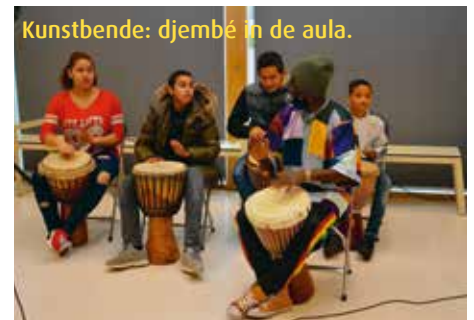
Kunstbende: djembé in de aula.

Eind oktober organiseerde de jongerenorganisatie Kunstbende een dag vol workshops voor de derdejaars leerlingen. Er waren workshops als hip-hop dans, theatersport, rap en djembé, maar ook de workshops dj, lipdub of fotostrips maken. Doel van Kunstbende is te bevorderen dat jongeren actief met cultuur bezig zijn. De organisatie organiseert al 25 jaar een dergelijke wedstrijd in kunst voor alle jongeren tussen de 13 en 19 jaar. De organisatoren zagen op Pantarhei genoeg creatief talent dat aan de landelijke wedstrijd kan meedoen.