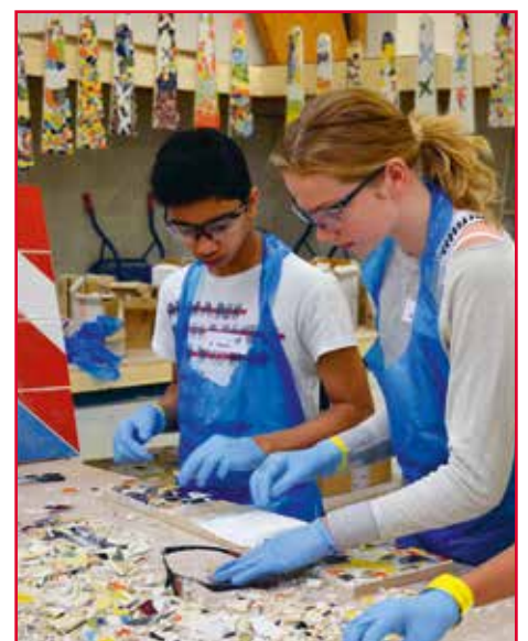
Techniekdag: workshop mozaïek maken.

Elaine denken meisjes vaak ten onrechte dat techniek een mannenvak is. "Er zijn voor meiden ook heel veel mogelijkheden. Veel richtingen zijn onbekend, maar zo ontzettend leuk! Neem nou de grafische vormgeving, decoropbouw, goudsmederij of fijnelektra. En niet te vergeten beroepen als